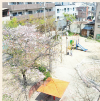
ホームに隣接する緑豊かな公園

費用：月々 143,018 円から (家賃、食事、光熱費他、介護保険自己負担含む)