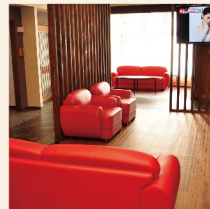
くつろいで過ごせる、ゆとりの空間

広々とした共有スペースを中心に回廊をはさんで居室を配した優雅なホーム。9名様のご定員で3ユニットの構成です。