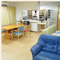
みんなが寄り添い笑って過ごせる空間

居室とリビングを上下階でセパレートしている独特のつくりで、入居者様はいつもお出かけ気分。8名様のご定員で2ユニットの構成です。