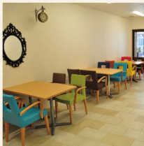
みんなで集い、余暇をすごせる場所

費用：月々 171,018 円から (家賃、食事、光熱費他、介護保険自己負担含む)