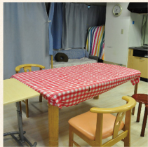
みんながそろって食卓