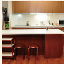
料理を楽しめる大きめのカウンター