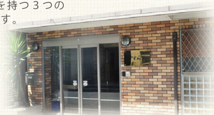
第2グループホーム

「やすらぎ」専属のシェフが腕を振るう自慢の料理。四季折々の食材を用いて食卓を彩ります。