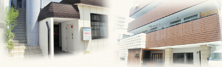
第3グループホーム